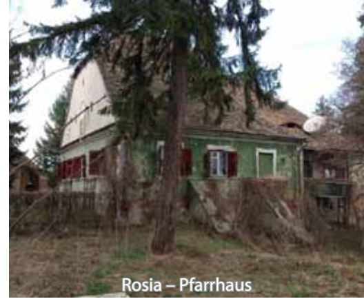
Rosia – Pfarrhaus