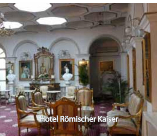
Hotel Römischer Kaiser